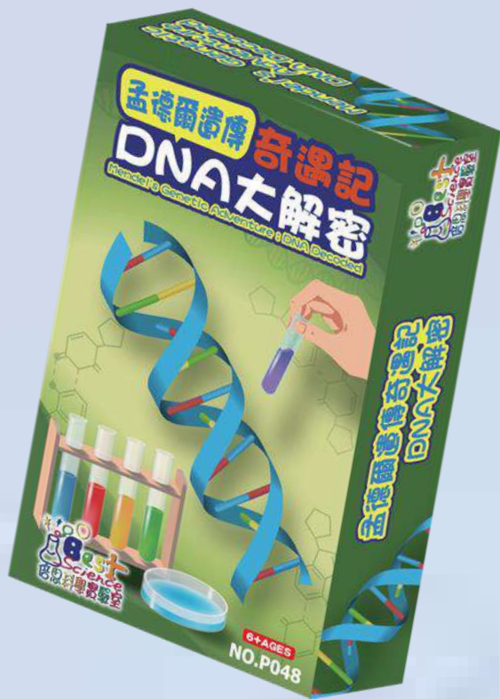
寶盒贈品 (內含 DNA 模型材 料盒、實驗器材組)