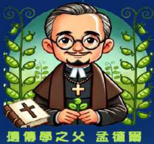
遺傳學之父 孟德爾