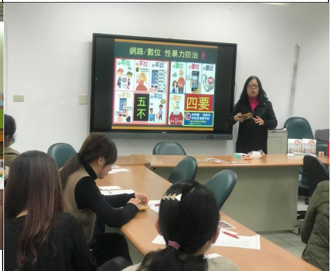
說明：親師研習討論網路數位性暴力之四要五不。