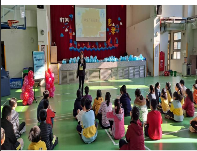
說明：海洋大學師培生進行海洋生物家庭關係講座並做有獎徵答。