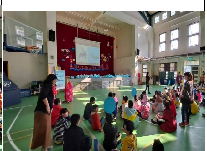
說明：海洋生物海馬撫育寶寶與性平關係。