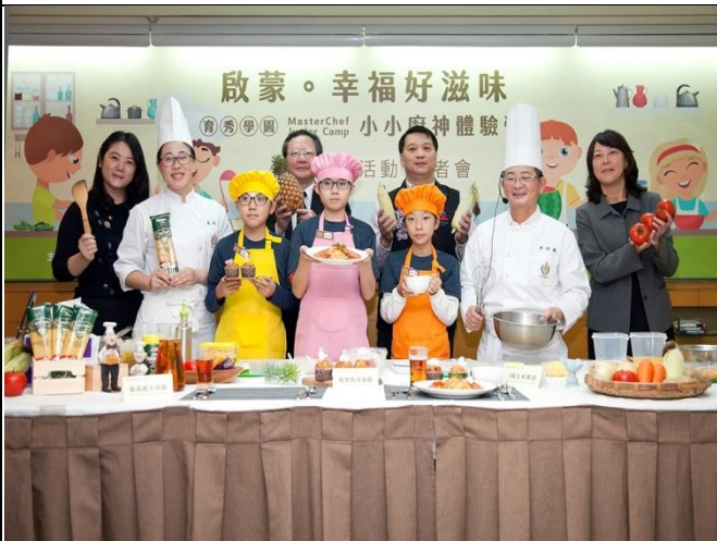
說明：六年級三位同學參加育秀學園小小廚師體驗營。