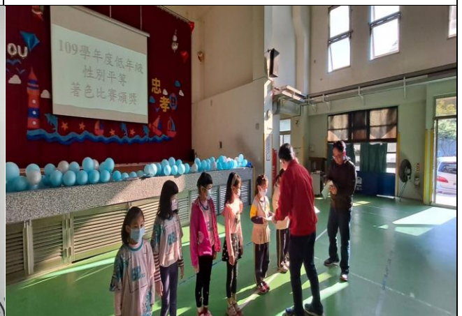
說明：低年級性別平等著色比賽頒獎